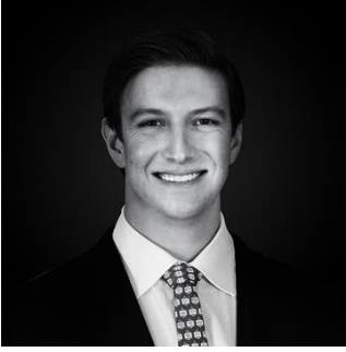
เขียนโดย: Andrew Little, CSRIC นักวิเคราะห์ประจำสถาบันวิจัย